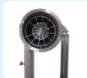
Behälterreiniger mit Schlauchtrommel Ex