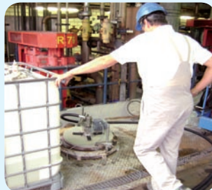
Mischerreinigung von oben