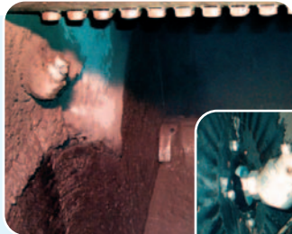
Doppelwellen-Mischer vor und nach der Reinigung