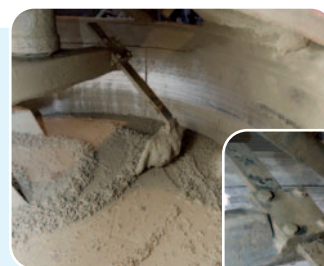
Planetenmischer vor und nach der Reinigung