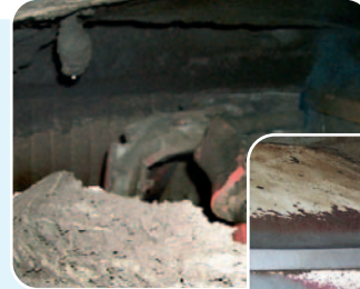
Tellermischer vor und nach der Reinigung